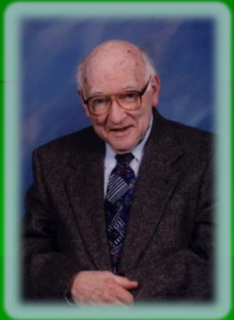
Еліс Пол Торренс